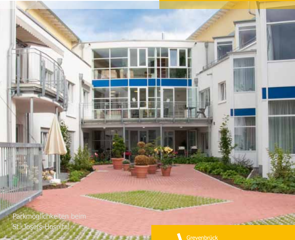
Parkmöglichkeiten beim St. Josefs-Hospital